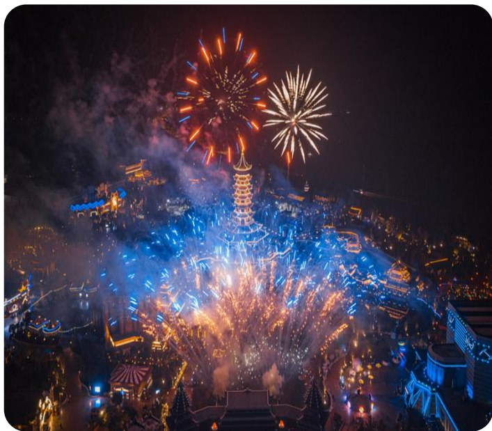
开业盛典：百万级烟花无人机秀