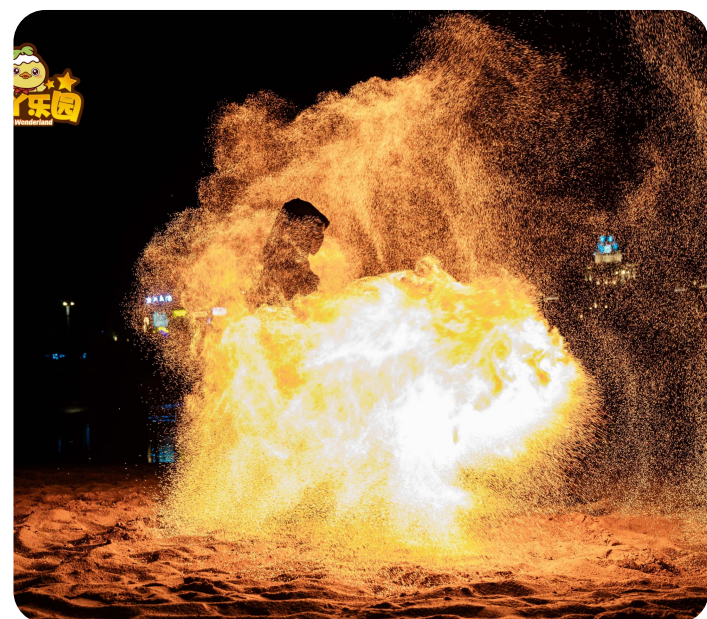
燃火派对：打铁花、火壶、烟花秀

开业盛典： 百万级烟花无人机秀以顶级视听盛宴为首发记忆点，整合高空光影与地面庆典，瞬间拔高品牌格调，迅速确立区域文旅头部地位；