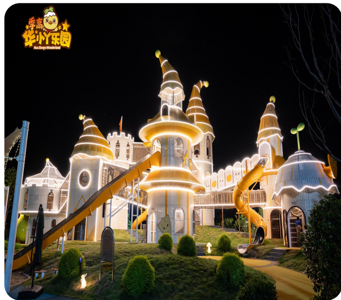
暑期夜场：沉浸式夏夜狂欢地标